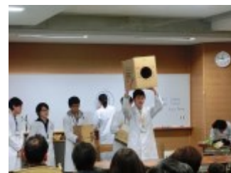
空気砲を用いた実験