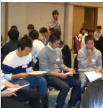
大学体験プログラムの様子

品川水族館・国立天文台・フジテレビ・ポケモン株式会社・防衛省・本所都民防災教育センター・科学技術館・一般財団法人進化生物学研究所・NTTドコモ歴史展示スクエア・宇宙ミュージアム・くすりミュージアム・Yahoo・国会議事堂・最高裁判所・富士通・国立科学博物館・ダイソン株式会社・株式会社サンリオ・味の素・YONEX・大和ハウス工業株式会社・江戸川区自然動物園・講談社・株式会社KADOKAWA・LINE株式会社・株式会社オリエンタルランドなど