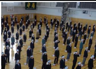
先生方も後方から見守る