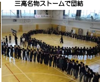
三高名物ストームで団結