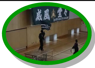
団旗を振るう応援団